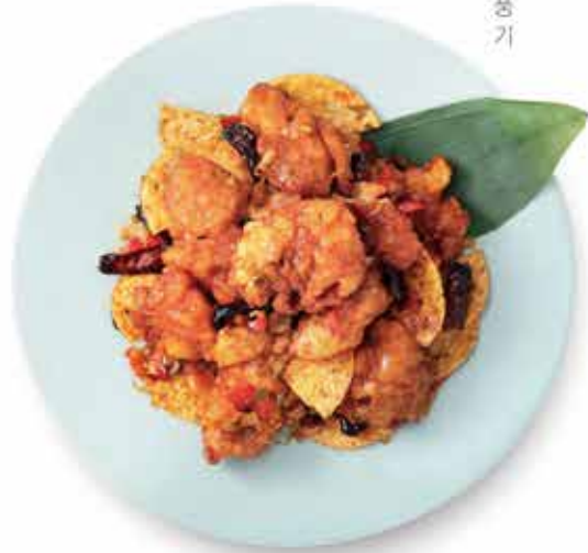
간 풍 기